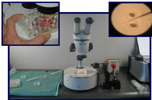
Une configuration typique pour la manipulation des embryons.

L'utilisation du transfert embryonnaire a réduit radicalement les coûts et a simplifié les opérations associées à l'importation et à l'exportation de matériel génétique. Des troupeaux entiers peuvent être transportés dans un biostat à un coût qui est souvent inférieur à celui du transport d'un seul animal.