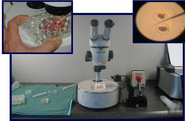
Une configuration typique pour la manipulation des embryons.

L'utilisation du transfert embryonnaire a réduit radicalement les coûts et a simplifié les opérations associées à l'importation et à l'exportation de matériel génétique. Des troupeaux entiers peuvent être transportés dans un biostat à un coût qui est souvent inférieur à celui du transport d'un seul animal.